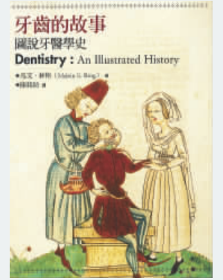
《牙齒的故事——圖說牙醫學史》作者：Malvin E. Ring 譯者：陳銘助 出版：邊城 售價：$217

這是一本不便宜的書，但卻趣味十足。翻開《牙齒的故事——圖說牙醫學史》書中的每頁，最少也有一張圖片敘述牙齒的故事。很多疾病古今皆有，牙周病就是其中一例。把埃及法老王的遺體送到X光下，便照出了他患牙周病的秘密——上顎後排的牙全掉下來。