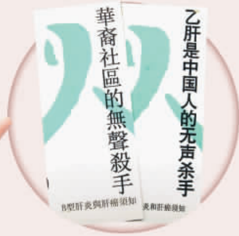
中文單張 「翡翠絲帶」運動以亞裔為對象，網頁及單張均備繁體中文、越南文、韓文及英文版。圖為繁體及簡體中文單張。