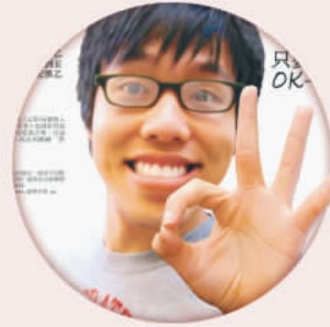
疫苗護肝 「翡翠絲帶」運動深入內地。這張醒目的海報，以年輕人為對象，宣傳疫苗能終身保護人們免受乙肝病毒的威脅。