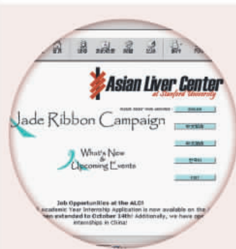
翡翠絲帶網頁 美國史丹福大學亞裔肝臟中心及「翡翠絲帶」運動網頁。 網址：liver.stanford.edu