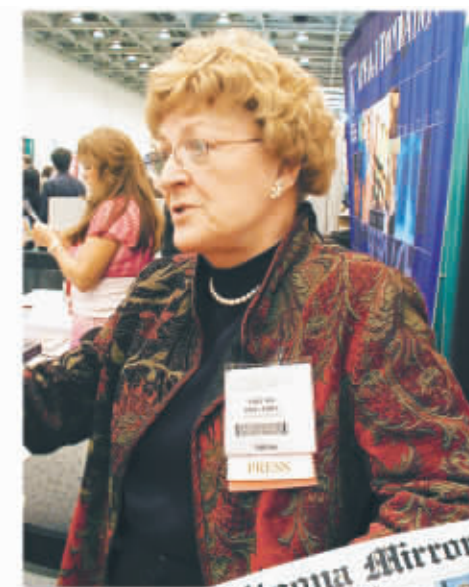
肝臟夫人 國際肝炎基金會主席Thiel(上圖)歡迎各地有志推廣肝臟健康的團體翻譯她的單張，傳播護肝的信息，被報章稱為Liver Lady(肝臟夫人)(右小圖)。

快到80歲的Thiel依然精力過人，走遍全美各州，爲教師、輔導員、護士甚至醫生教授溝通技巧，又上電視及電台接受訪問，好讓更多人學懂如何用快捷又簡單的方法，散播護肝的信息。